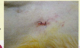
▲腹腔鏡で行った手術。こんなに傷の大きさが違うんです！