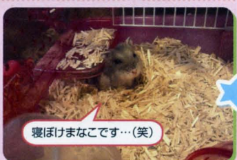
寝ほけまなこです…(笑)