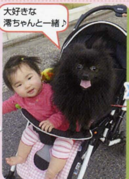
大好きな 滞ちゃんと一緒に♪