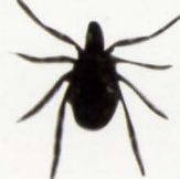
シュルツェマダニ