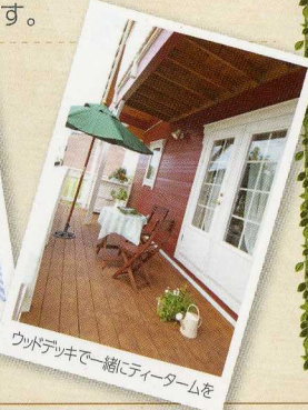
ウッドデッキと一緒にティータイムを