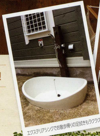
エクステリアシクでお散歩帰りの足拭きもラクラク

せっかくのリフォーム、かわいいペットのために ちょっとした工夫を取り入れてみませんか? 少しの工夫でペットたちと過ごしやすい、楽しい 空間を作ることができます。