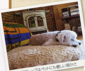
新ストーブは、ペットにも優しい暖かさ