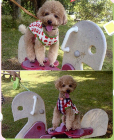
● あんココママさん あん&ココ