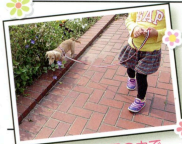
まずは安全な公園の中で

そのまま公園を出てからも一緒に歩き続け、いい雰囲気になってきました♡犬達にとって小さい子供たちは恐怖の対象にもなりますが、両方に仲良くなれる接し方を教えてあげれば、最高の友達にもなるのです(=^▽^=)