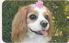
晴れの国 おかやまで 生まれ育ち中の マーチです。