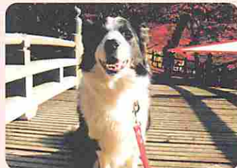
ボーダー・コリー 6才 ラッシュ