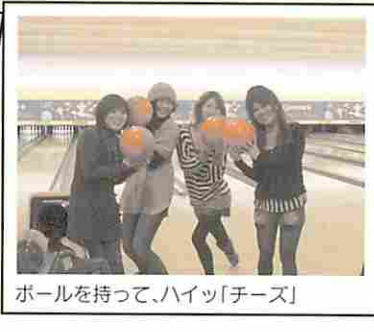
ボールを持って、ハイッ「チーズ」