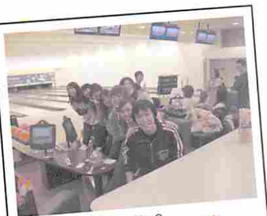
チューチュートレイン?