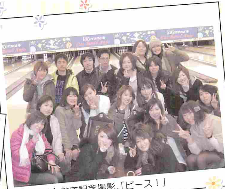
最後はみんなで記念撮影。「ピース!!」

こうして楽しんでいる間も病院では当番の先生(この時は院長でした)や看護師さんは出勤して入院している患者さんや救急への対応をしています。やっぱり病院にお休みは無いようです。今日は1日楽しんで気分もリフレッシュ!明日からも皆さんの支えとなるよう笑顔で頑張りま〜す。