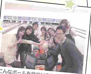
こんなボールを見つけましたっ!!