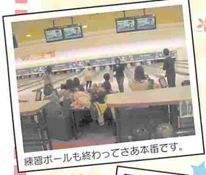
練習ボールも終わってさあ本番です。