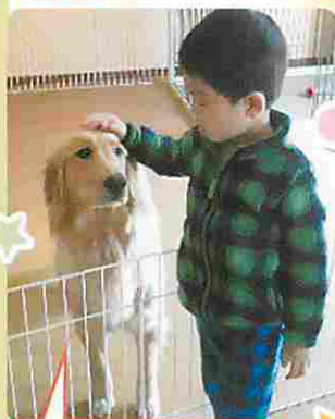
お兄ちゃん 大好きだワン!