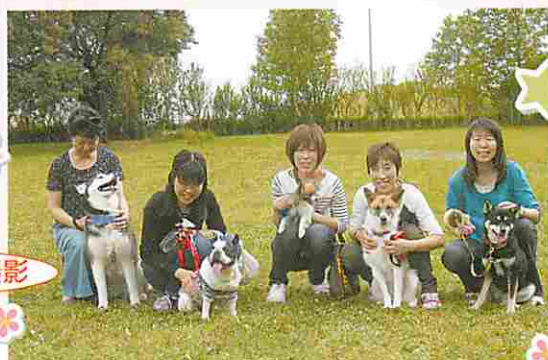
緑の中で記念撮影

大切な家族のワンちゃんと もっと楽しく暮らすために 「一緒に学んでいこうよ」と集まった仲間たち。 三回目は、しつけ方教室。 ワイワイみんなで学んで、楽しむひとときを レポートします。