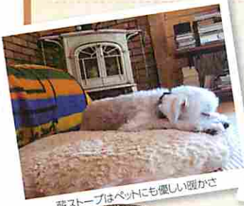
薪ストーブはペットにも優しい暖かさ