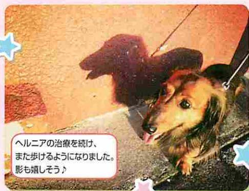
● さえさん アリスちゃん 12歳 ミニチュアダックスフント