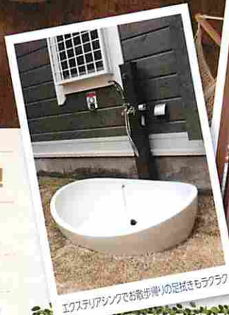
エキストラアシンプでお散歩靴の足拭きもラクラク