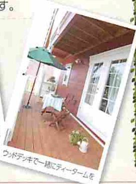
ウッドデッキで一緒にティータイムを