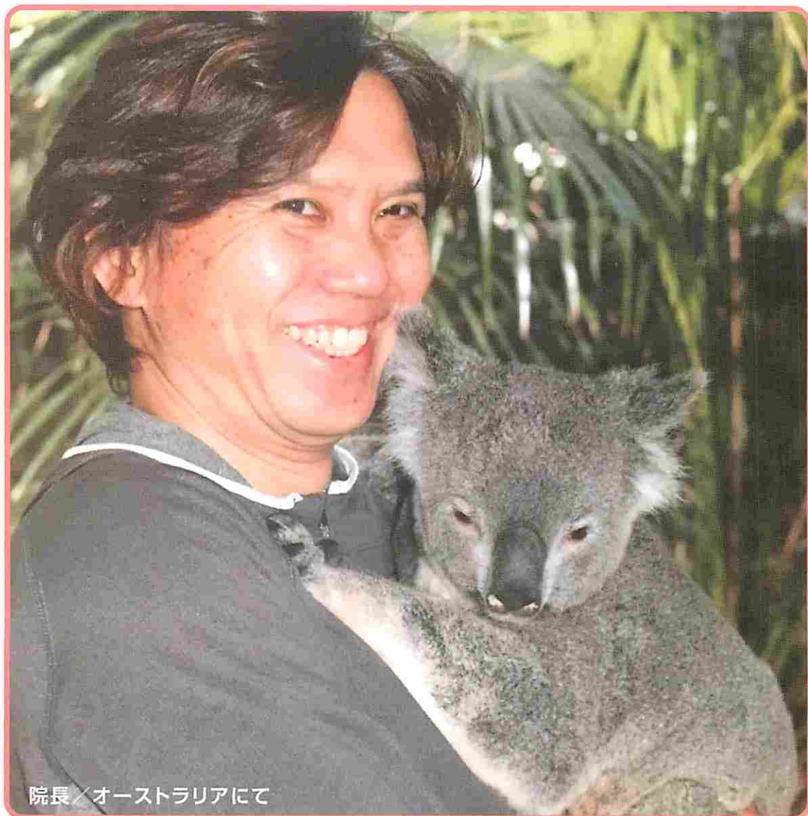
院長 / オーストラリアにて