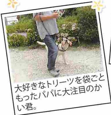
大好きなトリーツを袋ごともったパパに大注目のかい君。