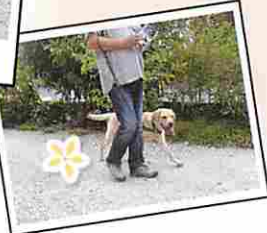
またもらえるかな〜♥