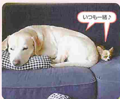
● なな&そらママさん そらちゃん 千ワワ ななちゃん ラブラドルトリアー